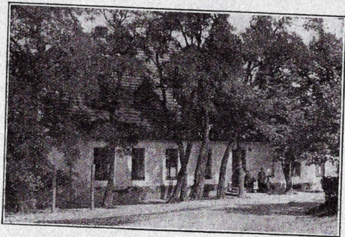
Stará česká škola v Husinci u Střelina, Prus. Slezsko.