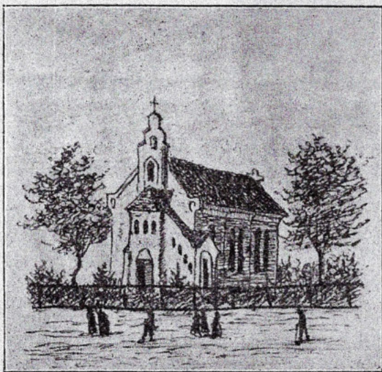
Evang. kostelík v Petrovicích (Petersgrätz).

jest 12 km. Může se tam jíti dvěma směry, na horní nebo